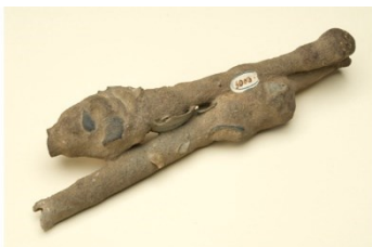
Campione di calcite studiato e descritto da Stenone

Nelle attuali collezioni sono sicuramente della raccolta di Stenone una goethite e un'altra incrostazione calcarea.